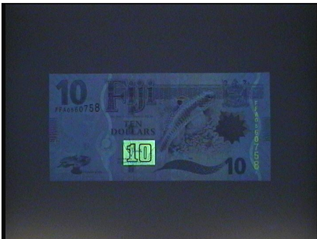
Ультрафиолетовый верхний свет (365 нм)