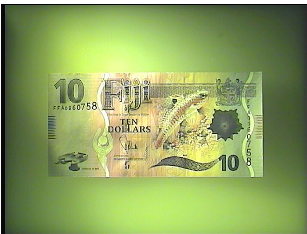
Белый косопadaющий свет