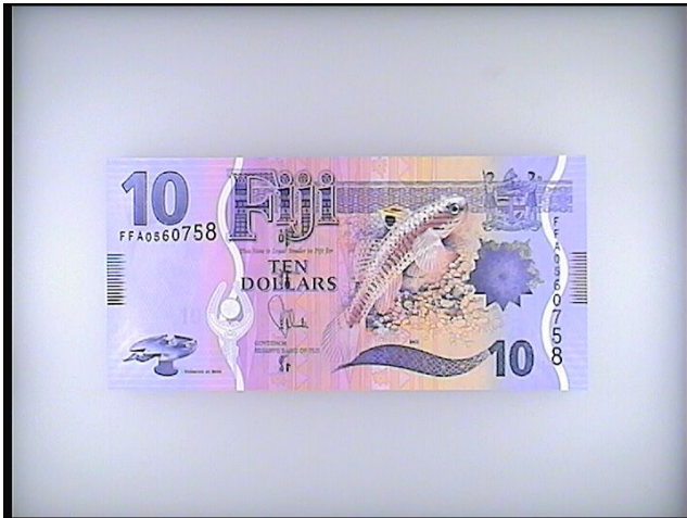
Белый верхний свет