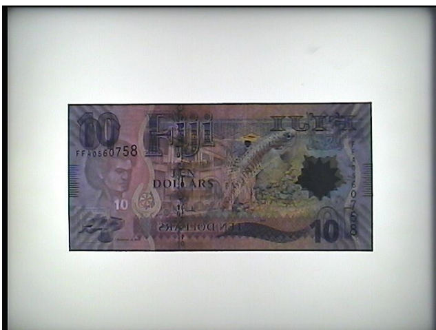
Белый донный свет