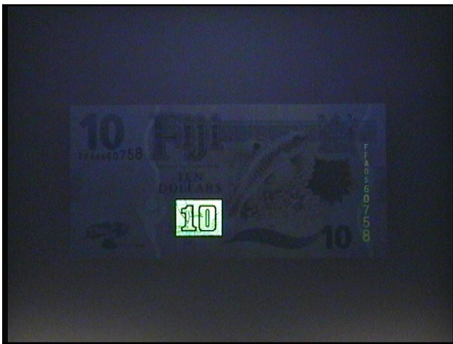
Ультрафиолетовый верхний свет (313 нм)